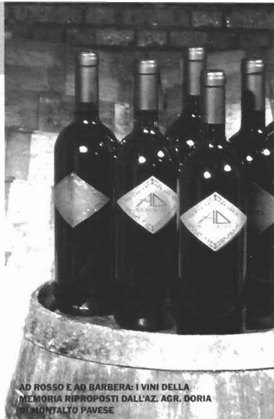
AD ROSSO E AD BARBERA: I VINI DELLA MEMORIA RIPROPOSTI DALL'AZ. AGR. DORIA DI MONTALTO PAVESE