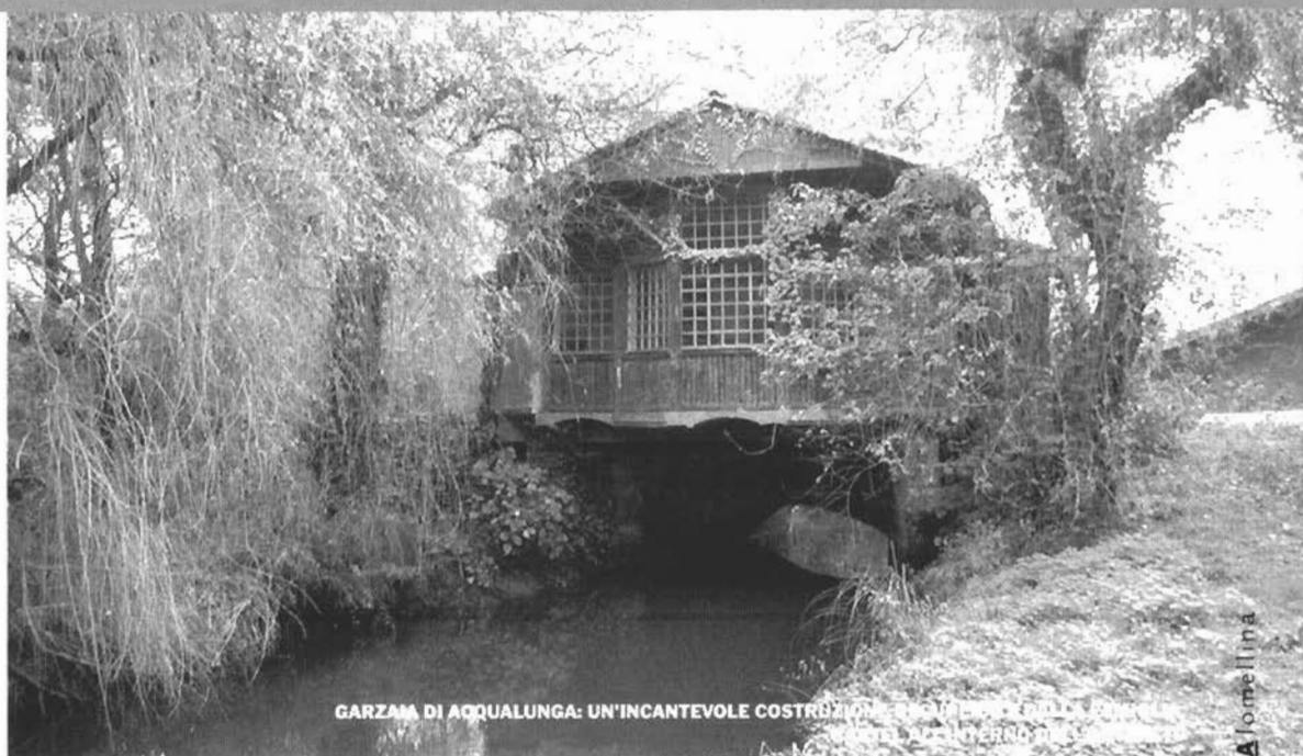
GARZAIA DI ACQUALUNGA: UN'INCANTEVOLE COSTRUZIONE IN LEGNO E CANGIALE CANTINA SOTTERRANEA