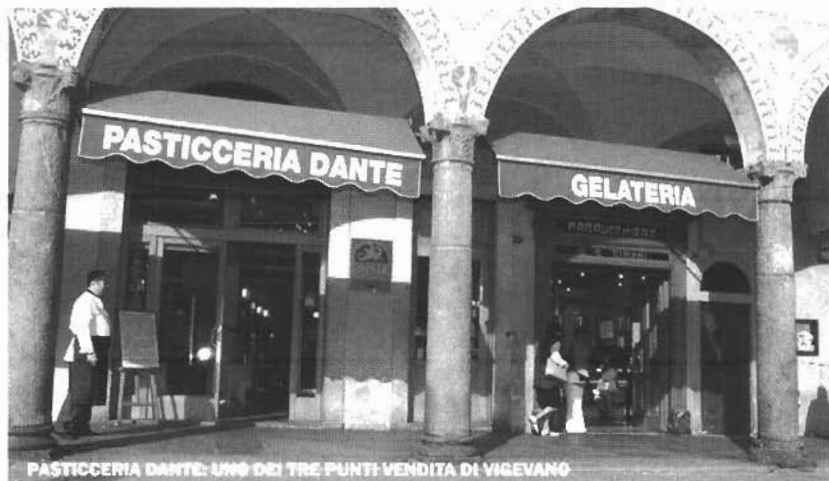
PASTICCERIA DANTE: UNO DEI TRE PUNTI VENDITA DI VIGEVANO